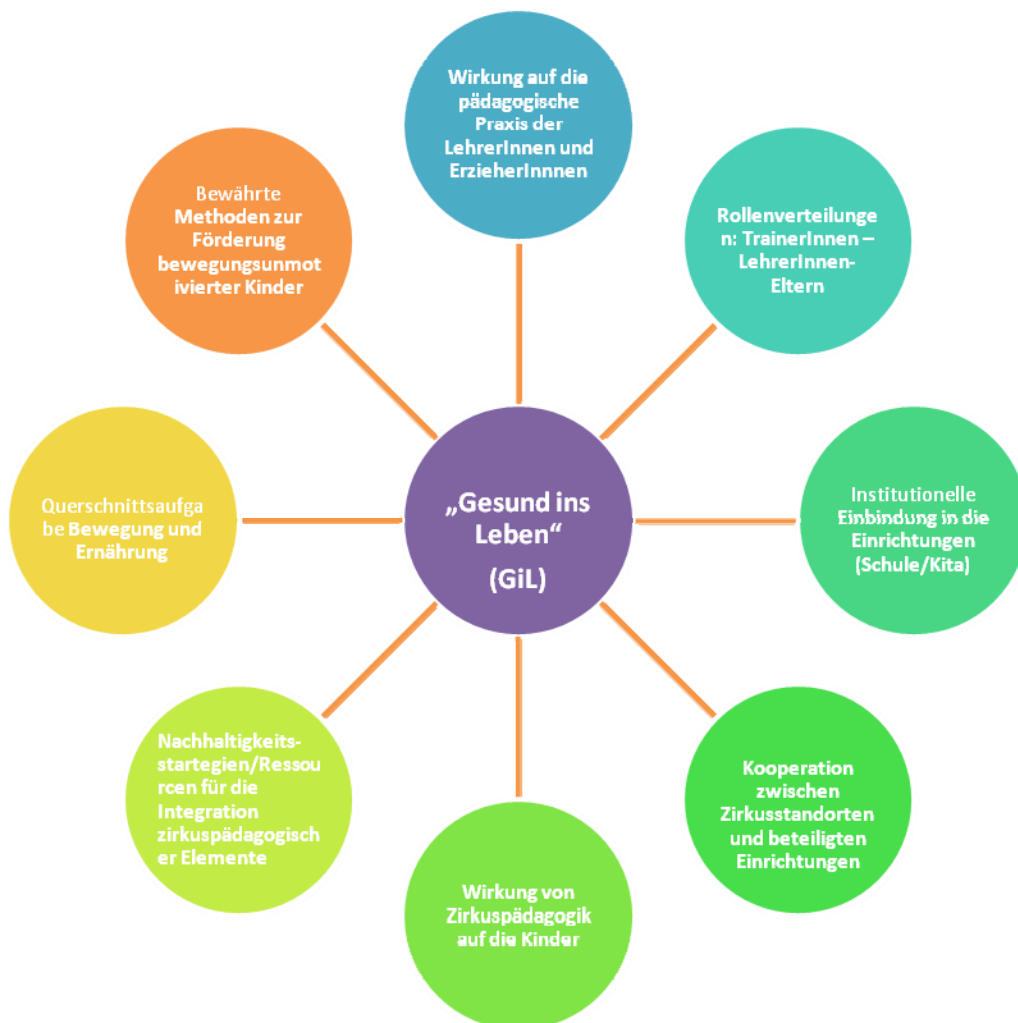
Abbildung 1: Evaluationsschwerpunkte des Projekts "Gesund ins Leben"

In Absprache mit der Projektleiterin wurden folgende Themenschwerpunkte für die Evaluation des Projekts „Gesund ins Leben“ definiert: